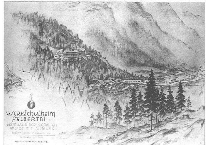
Wir versuchten einen Kompromiss zu finden, indem wir verschiedene Ausbaupläne im Felbertal diskutierten und auch von Architekten Vorschläge ausarbeiten ließen.

Im Kreis der Erwachsenen gab es viele Gespräche über dieses Thema.