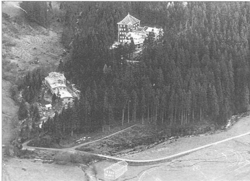
Allerlei Planungen, wie man die Raumnot beseitigen und doch im Felbertal bleiben könnte

Zunehmend gerieten wir in innere und äußere Konflikte. Einerseits war uns klar, dass das Werkschulheim Felbertal für uns weit mehr geworden war, als nur ein zufällig gefundener Aufenthaltsort. Das Felbertal hatte uns geprägt, es war Herausforderung, es war Zeuge unseres Seins geworden, war mit ein bestimmender Faktor unseres Geistes und unserer Lebensart. Im Überwinden seiner Härten und im Genuss seiner Schönheiten hatten wir unser Werk geschaffen, hatten unser „Reich“ gebaut.