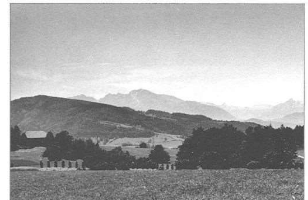
Verschiedene Gegenden werden für einen neuen Standort erkundet.